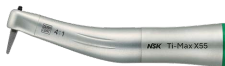
MODEL Ti-Max X55

Et IPR-vinkelstykke er et vinkelstykke til interproximal reduktion (IPR) af tænderne. Det er designet til at fjerne minimale mængder tandmateriale fra tændernes laterale overflade, hovedsageligt mellem tænderne, for at skabe plads og rette op på tændernes placering. IPR-vinkelstykket muliggør nøjagtigt og kontrolleret tandjustering ved at fjerne små mængde af emalje. Det er et vigtigt komponent i ortodontisk behandling, især ved brug af fast apparatur eller andre tandjusterings metoder, for at opnå den ønskede tandstilling og en harmonisk bidjustering.